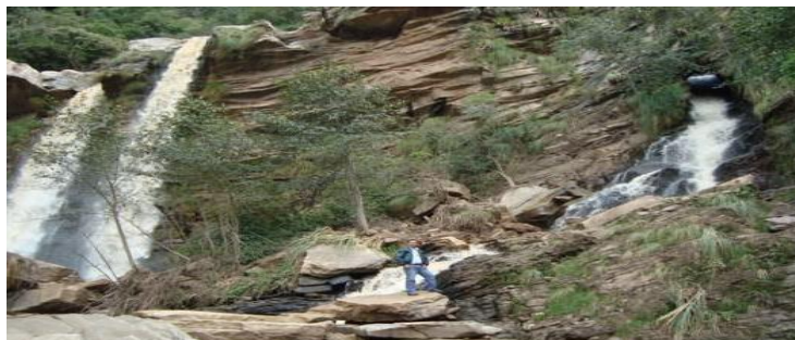
Imagen Nro.3 Pajcha de vilcas.

Este lugar se encuentra en la comunidad de Vilca, ubicada a una distancia de 7 km de la población de Postrovalle, son dos caídas de agua con bastante caudal y exuberante riqueza natural, la flora y fauna silvestre abundan en gran proporción en este paraíso ecológico, ya que el clima es templado lugar propicio para el crecimiento de helechos gigantes y plantas herbáceas, lugar apto para acampar, practicar el turismo aventura, excursiones, camping rappyn y observar la belleza paisajística muy importante para la práctica del ecoturismo.