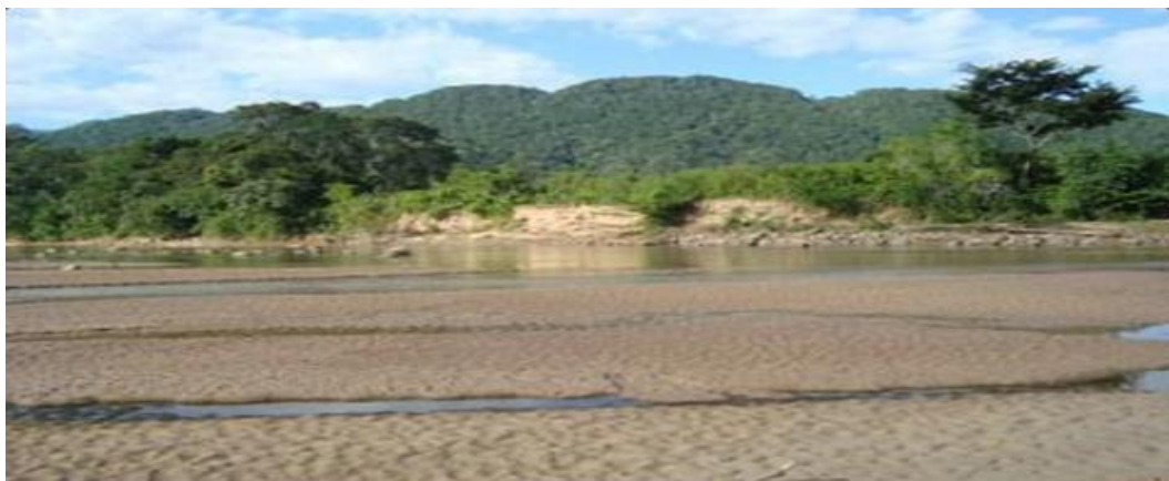
Imagen Nro. 1 Quebrada de Mosquera.

Este lugar, está ubicado en la comunidad de Mosquera, a una distancia aproximada de 60 km del pueblo de Postrervalle, es una quebrada con aguas cristalinas, de clima caliente, con significativa flora y fauna silvestre, apta para acampar y apreciar la exuberante riqueza natural que ofrece esta zona.