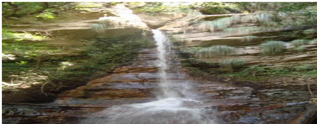
Imagen Nro. 2 Pajcha del Elevés.

Este magnífico lugar se encuentra ubicado aproximadamente a 7 km del pueblo de Postrovalle, la belleza natural de este lugar es impresionante, presenta un aspecto intacto, a sus alrededores existen piscinas naturales de aguas claras, formaciones rocosas, abundante flora y fauna silvestre, lugar apropiado para practicar el turismo aventura, especialmente para aquellas personas que les gusta explorar y lanzarse a la aventura. El acceso para llegar a este lugar es hasta cierta parte en vehículo y luego caminando, la ruta que se toma es por el camino a Mosquera hasta el cruce para llegar a la comunidad de Pampas, de ahí se aparta hacia la derecha caminando aproximadamente 45 minutos.